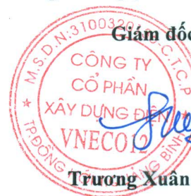
Trương Xuân Phúc